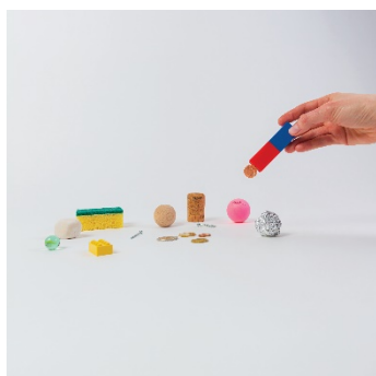
Pièce de 5 centimes: magnétique

Pour découvrir quels matériaux sont magnétiques, les enfants doivent placer un simple aimant (ou barreau aimanté) contre chaque objet. Si l'objet est attiré par l'aimant, il est magnétique.