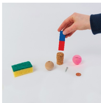
Bouchon: pas magnétique